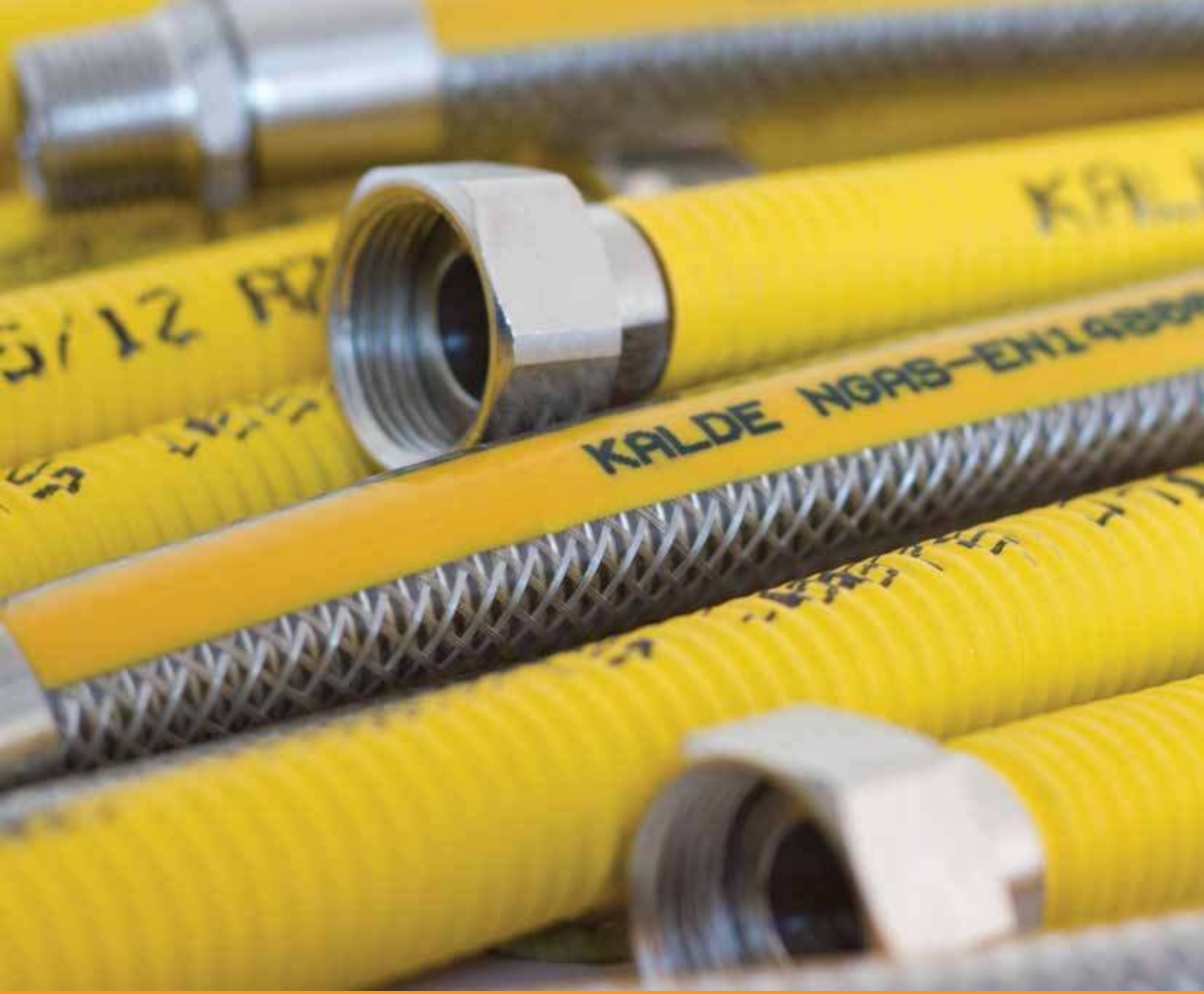
Flexo Gaz Hortumları