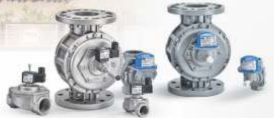
GAZ VALFİ VE DEPREM VANALARI