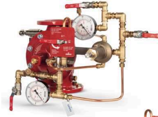
77DE-HRV-MR Manuel Reset