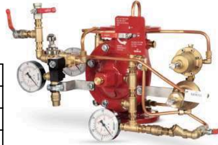
77DE-EL-PORV-PR-MR Manuel Reset