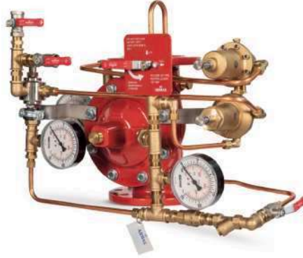
77DE-HRV-PR-MR Manuel Reset

Gövde : Sfero Döküm-GGG50 Bağlantı Şekli : Flanşlı-ISO veya ANSI Maks. Çalışma Basıncı : 300 psi-21 bar Maks. Çalışma Sıcaklığı : 80 °C