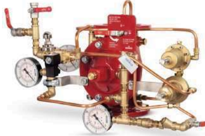
77DE-EL-HRV-PR-MR Manuel Reset