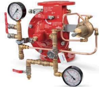
77DE-PN-RR Remote Reset