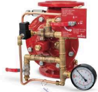
77DE-EL-RR Remote Reset