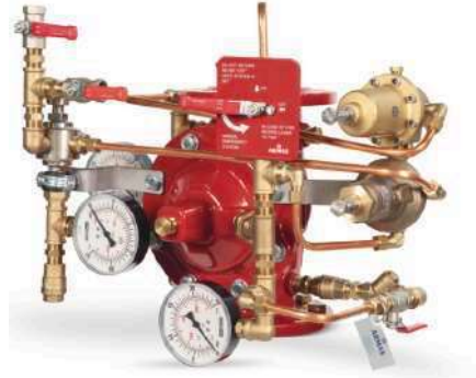
77DE-PORV-PR-MR Manuel Reset

Gövde : Sfero Döküm-GGG50 Bağlantı Şekli : Flanşlı-ISO veya ANSI Maks. Çalışma Basıncı : 300 psi-21 bar Maks. Çalışma Sıcaklığı : 80 °C