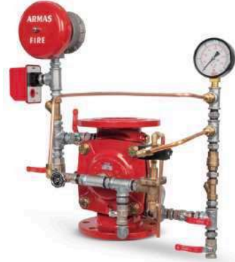
67DE-EL-AL Full Trim Set