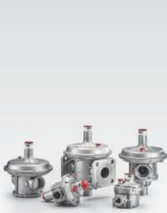
TEK KADEMELİ GAZ BASINÇ REGÜLATÖRLERİ