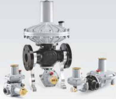
DİREKT ETKİLİ GAZ BASINÇ REGÜLATÖRLERİ