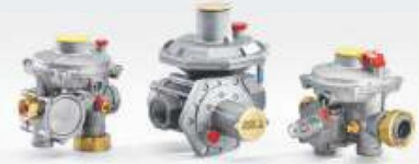
ÇİFT KADEMELİ SERVİS REGÜLATÖRLERİ