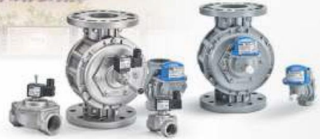
GAZ VALFİ VE DEPREM VANALARI